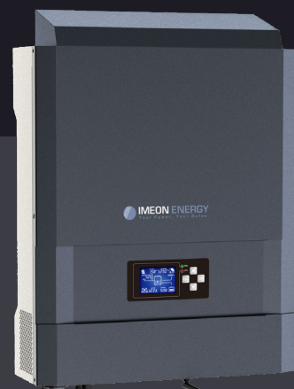
IMEON 3.6 Hasta 4kWp Monofásico