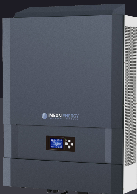
IMEON 9.12 Hasta 12kWp Trifásico